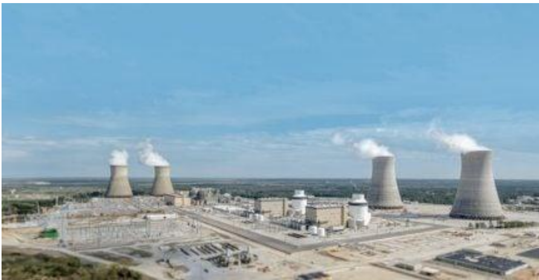
佐治亚州的阿尔文·W·沃格特勒发电厂现已是美国最大的核电设施

尽管美国核电发展在 1990 年后基本陷入停滞，但对于这个拥有全球最大核电装机量的国家而言，核能仍是清洁能源的关键来源。新的驱动因素正在涌现，有望为该行业注入生机，使其重获新生。